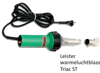
Leister warmeluchtblazer Triac ST