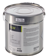
hechtprimer FG 35 4,5 kg 12 kg