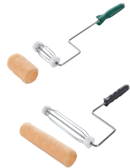
roller frame + wegwerp- rollerhoes 11 cm 22 cm