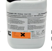
PU-lijm PU-LMF-02 6 kg