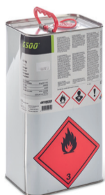
reiniger G500 4 kg