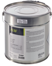
hechtprimer FG 35 4,5 kg 12 kg