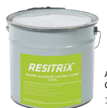
Alulon MF Coating 12,5 kg