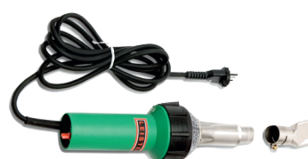
Leister warmeluchtblazer Triac ST