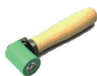
ergonomische aandrukrol 4 cm