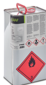
reiniger G500 4 kg

Volg altijd de initiatieopleiding en de handleiding alvorens te starten met de verwerking.