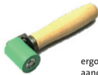
ergonomische aandrukrol 4 cm